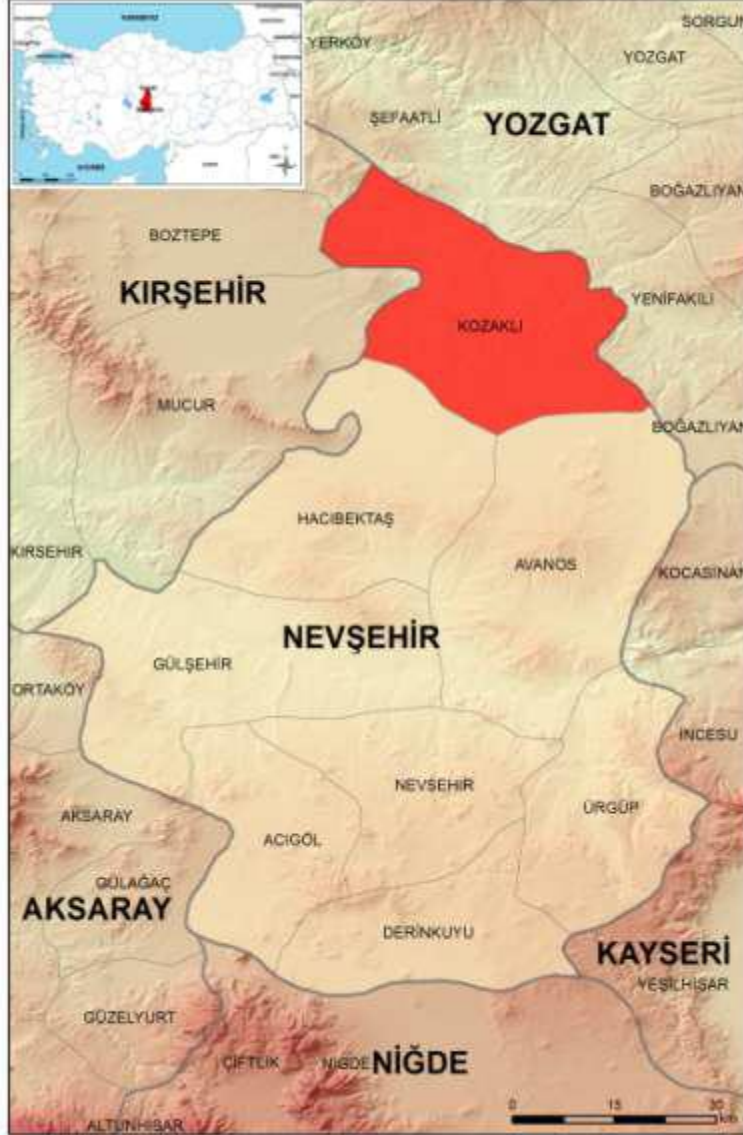
Şekil- 3: Kozaklı İlçesi Lokasyon Haritası 14

Kozaklı kaplıcaları Alman Kaplıcaları Birliği sınıflamasına göre Sodyum'lu, Kalsiyum'lu ve Klor'lu olup A ve C grubu şifalı sular grubuna girmektedir. Su sıcaklığı 27°C ve 93°C arasında değişmektedir. Sağlık turizminde önemli bir yere sahip kaplıcalar ve içmeceler Kozaklı ilçesinde son yıllarda yapılan yatırımlarla kendini hissettirir duruma gelmiştir. Türkiye'nin en önemli Termal Sağlık merkezlerinden biri olan Nevşehir'in Kozaklı İlçesi'ndeki Turistik Konaklama Tesislerinde sağlık turizmine yönelik faaliyet içeren 20 adet otel ve motel, 7.700 yatak kapasitesi ile hizmet vermektedir. Özel hizmet veren kaplıcaların yanı sıra Kozaklı belediyesine ait kaplıcalar da bulunmaktadır. Bu sayede her bütçeye uygun